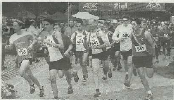
„Wuzzelauf“ 2014 – ein großer Erfolg!

Jugendlicher) gespendet werden konnte. Start und Ziel sind an der Kahlbachhalle in Bad Soden Altenhain, die Strecke führt durch das schöne Schmiehbachtal. Es gibt einen Kinder- und Jugendlauf