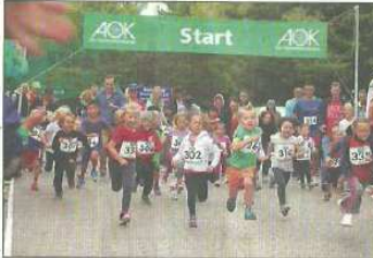
Die Kleinsten nahmen die Beine in die Hand und blitzten los.