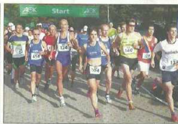
Die Teilnehmer des Halbmarathons, des 10 km Laufs sowie des Jedermanns laufs beim Start an der Kahlbachhalle.“